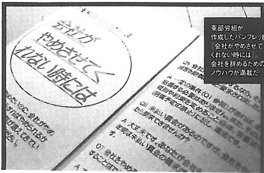
東部労組が作成したパンフレット「会社はやめさせてくれない時には会社を辞めるためのノウハウが満載」

「以来、些細なミスでも『何やってんだ!』と激しく怒鳴られるようになり、私も萎縮してきます。ミスが増え、また怒鳴られます。その繰り返し。でも、私も半人前だから言い返せなかったんです」 連日深夜まで続くサービス残業でクタクタになったが、「やっとなつかんぞ社員座を失いたくない」との思いで、「これが会社。早く一人前に!」との思い込みから、彼女は上司の理不尽な命令に黙々と従うようになる。 そんな彼女の様子に「危ない!」